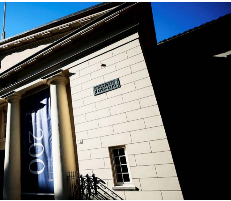
tror på muligheter for «all-time high» i de internasjonale aksjemarkedene før nyttår.